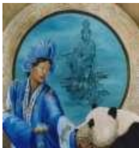
KWAN YIN – Deusa do Perdão, da Misericórdia e da Compaixão